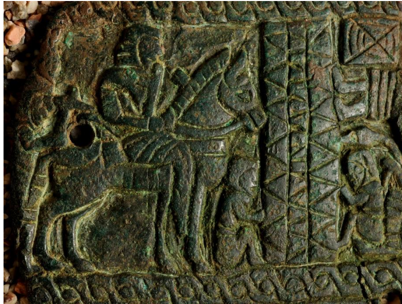
Рис. 3. Многофигурная композиция, мог. Нуркен-2. Раскопки под руководством А.З. Бейсенова.

Из многофигурных композиций выделяются изделия, изготовленные из бронзы, кости и рога. В первом случае это бронзовая плакетка с изображением мифической сцены прощания с покойником [10] (рис. 3), в другом случае застёжка от пояса, на поверхности которой заключена многофигурная композиция из зооморфных образов [8] и в третьем случае декор костяного футляра [11]. Как считают специалисты-археозоологи П. А. Косинцев и Д. О. Гимранов, футляр был изготовлен из трубчатой кости крупного копытного животного. При этом не уточняют - было ли это животное диким или домашним. Пожалуй, в искусстве сакского времени Казахстана данный футляр является пока единственной такой находкой, на поверхности которой заключено 16 изображений зверей и вихревой знак.