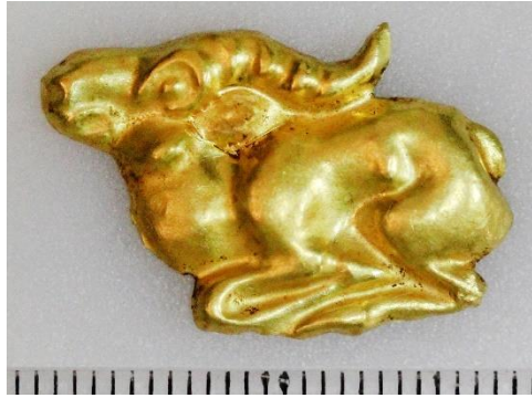
Рис.1. Изображение сайги, мог. Кызылшилик. Раскопки экспедиции под руководством А.З. Бейсенова.

волк (1), лось (1), птица (1), заяц (1), архар (1). Также в коллекции из Сарыарки выделяются изображения, чью видовую принадлежность определить затруднительно. Например, есть животное, сочетающее одновременно признаки оленя и зайца (1), копытное животное (1), рогатое копытное животное (1), незавершенное изображение зверя (1), хищник (6). Кроме того, среди находок выделяются такие, на поверхности которых присутствие животного выражено обобщенно в виде знака копыта. Рассмотрение каждого зооморфного образа заслуживает специального изучения, что выходит за рамки нашего исследования.