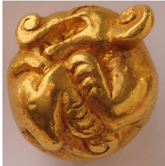
Рис. 1. Изображение хищника, свернувшегося в кольцо, курган «Иссык». Раскопки экспедиции под руководством К. А. Акишева.

В этом контексте особое звучание приобретает анализ изображений кошачьих хищников. Для раннесакского культурного горизонта звери обычно изображались свернувшимися в кольцо. Этот пример можно наблюдать при анализе изображений из Маймера [10], Талды-2 [6], Уйгарака [11], Шиликты [12]. Также свернувшийся в кольцо хищник присутствует среди материалов кургана «Иссык» [1] (рис. 1).