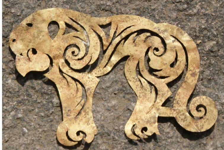
Рис. 2. Ажурное изображение кошачьего хищника, мог. Карашоқы. Раскопки экспедиции под руководством А. З. Бейсенова.

Стилистический прием изображения тигра находит аналогии в искусстве ранних кочевников других регионов Евразии. Во-первых, это ажурность, подразумевающая наложение вырезанного из золотой фольги изображения на контрастный фон, что обращает внимание на раннесакские изделия из клада Жалаулы в Жетысу [13]. В тоже время передача характерных полос и длинных прядей шерсти тигра встречается в более поздних изображениях тигра (пазырыкская культура на Алтае). Можно предположить, что описанный тигр представляет одну из линий развития изображений хищников на раннескифских оленных камнях, контуры которых заполнены полосами или пятнами, передающих, видимо, фактуру шкуры (тигр, барс). Хотя там несколько иная иконография зверя – ноги чуть согнуты и вытянуты вперед.