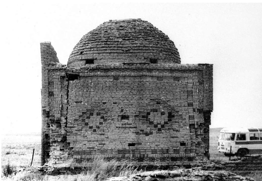
Рис. 5. Мавзолей Ахмета Танкаева (Қызылтам) [Fig. 5. Akhmet Tankayev Mausoleum (Kyzyltam)]