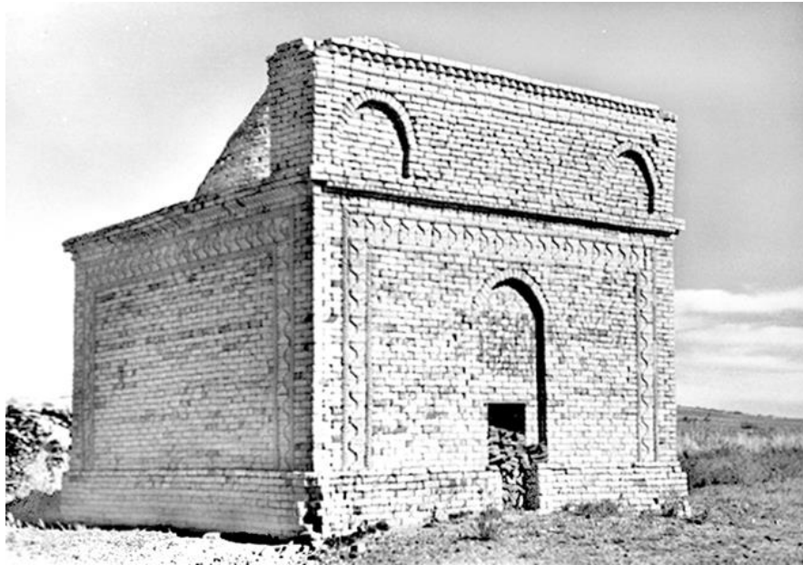
Рис. 1. Мавзолей Батима Алыскызы (Қыз тамы) [Fig. 1. Batima Alaskyzy Mausoleum]