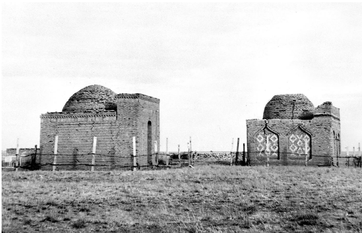
Рис. 3. Мавзолеи Айкожи и Байкожи (Қостам) [Fig. 3. Aykozha and Baykozha (Kostam) Mausoleums]