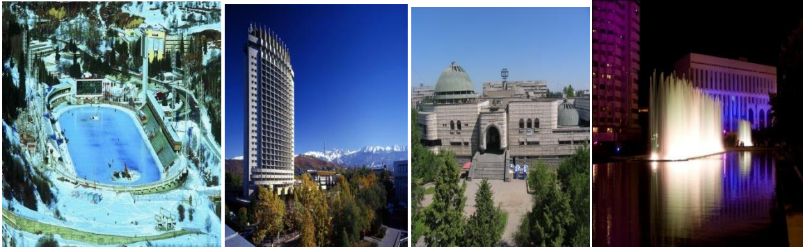
1 сур.-Медеу спорт кешені, 2 сур.- Қазақстан мейрамханасы, 3-сур. Арасан орталық сауықтыру орталығы, 4-сур. Республика сарайы.

Алматы қаласында соңғы 3-4 онжылдықтарда (1960-1990жж.) жоғары кәсіби деңгейдегі көптеген объектілер салынып бүкіл әлемге танылған бірегей қоғамдық ғимараттар мен құрылыстар, архитектура кешендері тұрғызылды. Осыған куә КСРО Мемлекеттік сыйлығын алған 3 объектіні айтуға болады: 1972ж. Республика Сарайы, 1974 ж. тау биіктігіндегі «Медеу» мұз айдыны кешені және 1982 ж. Қазақстанның Мемлекеттік сыйлығына ие болған 25-қабатты «Қазақстан» қонақ үйі, Шет елдерімен достық қоғамының үйі, және «Арасан» емдеу-сауықтыру кешені [25,106.].