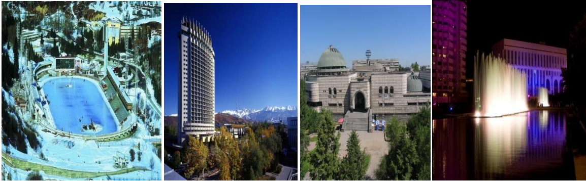
1 сур.-Медеу спорт кешені, 2 сур.- Қазақстан мейрамханасы, 3-сур. Арасан орталық сауықтыру орталығы, 4-сур. Республика сарайы.

Алматы қаласында соңғы 3-4 онжылдықтарда (1960-1990жж.) жоғары кәсіби деңгейдегі көптеген объектілер салынып бүкіл әлемге танылған бірегей қоғамдық ғимараттар мен құрылыстар, архитектура кешендері тұрғызылды. Осыған куә КСРО Мемлекеттік сыйлығын алған 3 объектіні айтуға болады: 1972ж. Республика Сарайы, 1974 ж. тау биіктігіндегі «Медеу» мұз айдыны кешені және 1982 ж. Қазақстанның Мемлекеттік сыйлығына ие болған 25-қабатты «Қазақстан» қонақ үйі, Шет елдерімен достық қоғамының үйі, және «Арасан» емдеу-сауықтыру кешені [25,106.].