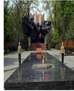
1 сур. -ҒА-ның бас ғимараты мен су бұрқақ- азаматтық сәулеттің үлгісі болып табылады. 2-сур- Республиканың Үкімет үйі, 3-сур.Оқушылардың республикалық сарайы, 1-ші сурет Даңқ мемориалы

50 ж. аяғында қала құрылысы Республиканың Үкімет үйі (1958ж.), ҒА-ның бас ғимараты құрылысы аяқталды. Орталық стадионның бас спорт аренасы (1958ж.), Облыстық саяси ағарту үйі (кейін қазақ филормониясы) салынды. Қала құрлысын салуда 60 ж. заман талабына сай Қазақстан архитектура мектебі қалыптасып, архитектуралық құрылыс жұмыстарында ұлттық нақыштар орын алды. Қаланың ресейлік архитекторлар 60ж. жасаған бас жоспарына наразылықтар туд, онда қаланың табиғи климаттық жағдайы мен оның құрылымдық ерекшеліктері ескерілмей, қала дамуының кезеңдеріне талдау жасалмады. Қаланың жедел өркендеуі 70 ж. бас кезінде саяды. Жер сілкінісіне төзімді отандық және шет ел құрылыс әдістерін ұтымды қолдану тәжірбиесі негізінде жаппай үй құрылысы 5 қабатты, ішара 7- 9, 12 қабатқа дейін көтерілді. Қаланың қарқынды дамуына және халық санының тез өсуіне байланысты 1970 ж-дан Алматының жаңа, IV бас жоспарын жасау жұмысы басталды. Оның жобасын Алматы қала құрылысы жобалау мемлекеттік институты еліміздің 13 арнайы жобалау және ғылыми-зерттеу институттары қатысуымен тұңғыш рет жасады.