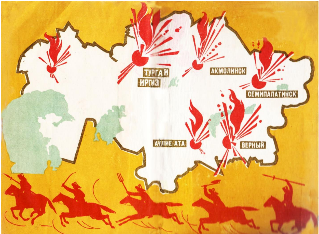
Сурет 1 - Қазақстандағы 1916 ж. ұлт-азаттық көтеріліс ошақтары

Т. Рысқұлов және басқа авторлардың еңбектерін пайдалана отырып Меркі көтерілісіне сипаттама берсек. Т. Рысқұловтың «Облыстар көтерілісінің басталуы, өршіп күшеюі. Сырдария облысы (дуаны)» атты мақаласында «Сырдария облысы елінің бәрі бірдей бас көтерген жоқ. Бір облыста көтеріліс алдымен 1916 жылы июльдің 11-інде ескі Ташкент қаласында басталды. Мыңнан астам халық ескі Ташкент полиция мекемесінің қасында жиналып, жұмысқа адам алу туралы бұйрықтың орындалуына қарсылық көрсетті», - дей келе Көкші, Сібзар, Шайқантауыр аудандарында, Қауыншы, Шыныяз, Тойтөбе қыстақтарында, Ақмешіт уезінің Кұлжан, Кенжеғұл, Жақай ауылдарында, Қазалы уезінде өткен көтеріліс толқындарына шолу жасап өтеді.